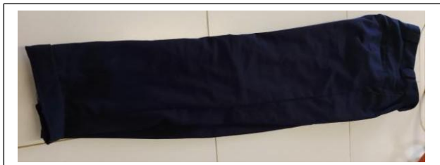
(sample ya suruali dark blue)