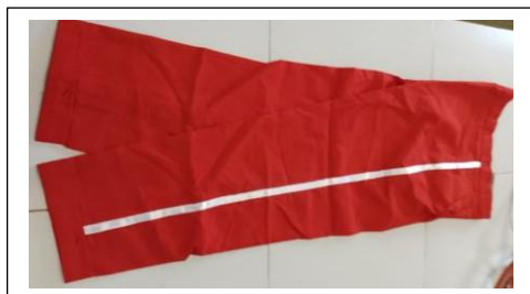
(Sample ya suruali nyekundu yenye mkanda mweupe)