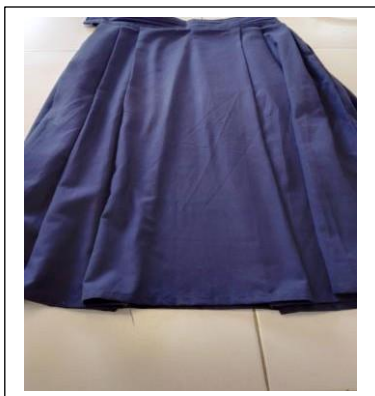
(Sample ya sketi rangi dark blue)