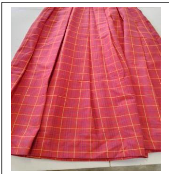
(sample ya sketi draft rangi nyekundu)