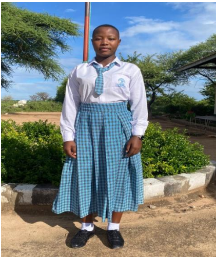
SARE YA DARASANI KWA WANAFUNZI WA KIKRISTO