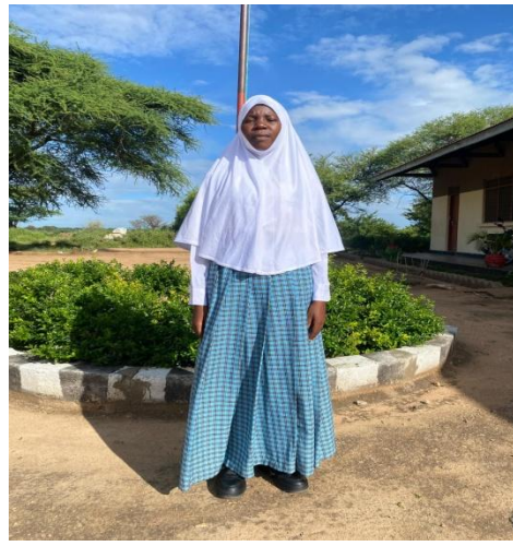
SARE YA DARASANI KWA WANAFUNZI WA KIISILAMU