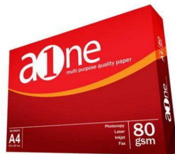
RIM ZA a1ne