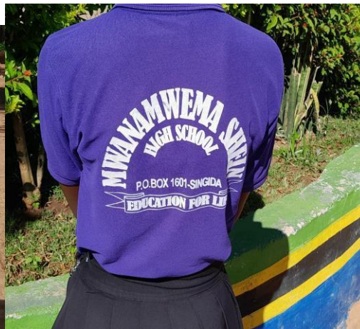
TISHETI YA SHULE