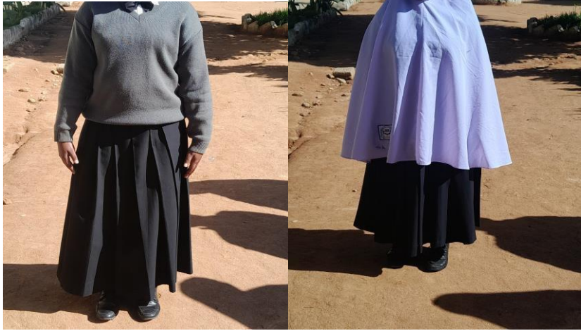
SARE RASMI YA SHULE