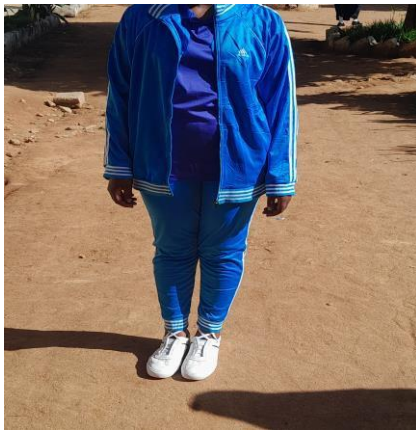
SARE YA MICHEZO