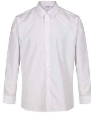
Shati jeupe la mikono mirefu