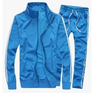
Track Suti za rangi ya bluu bahari