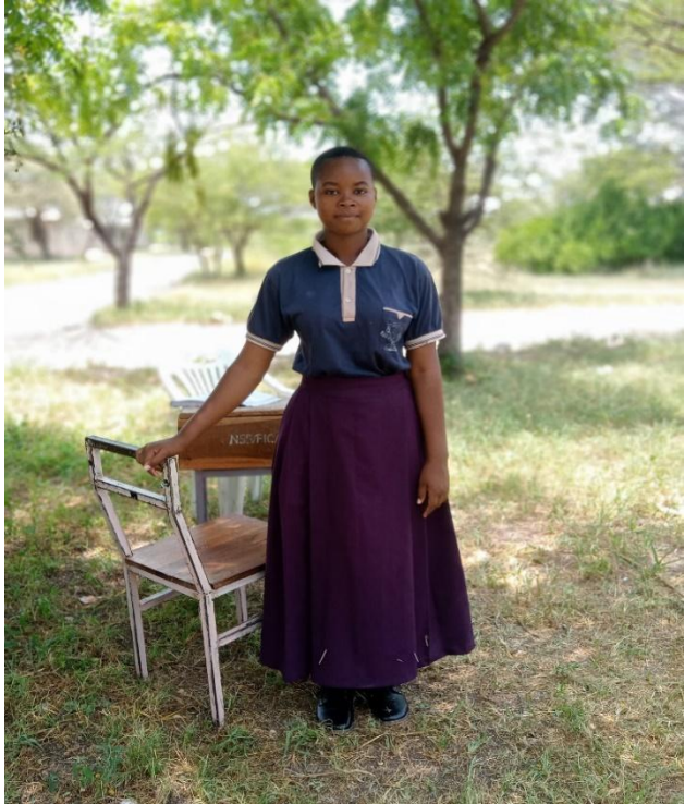
T-SHIRT YA SHULE