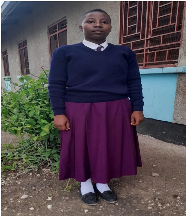
SARE YA DARASANI