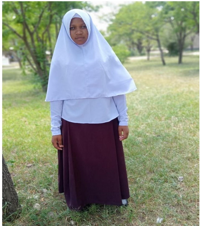
SARE YA DARASANI KWA WAISLAM