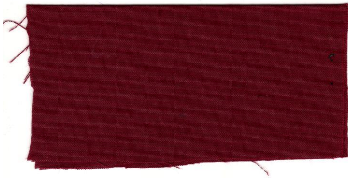
KITAMBAA CHA RANGI YA DAMU YA MZEE