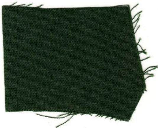
KITAMBAA CHA RANGI YA KIJANI KIJENSHI