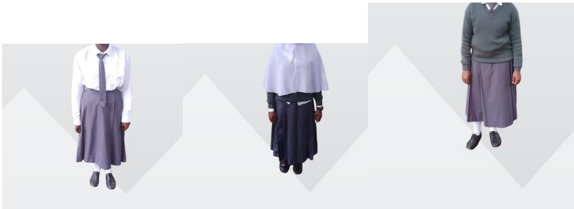
UNIFORM KWA AJILI YA WASICHANA NA MISHONO YAO