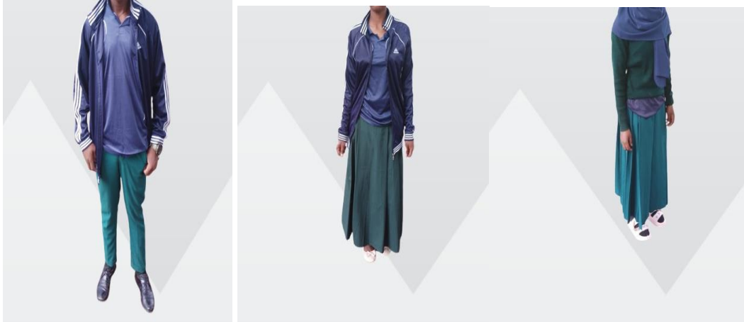
SARE ZA KUSHINDIA BAADA YA MASOMO NA SIKU AMBAZO HAKUNA MASOMO