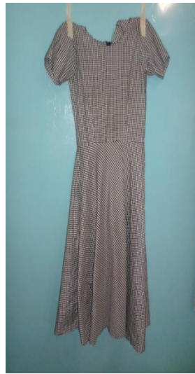
Rangi ya kitambaa cha shamba dress