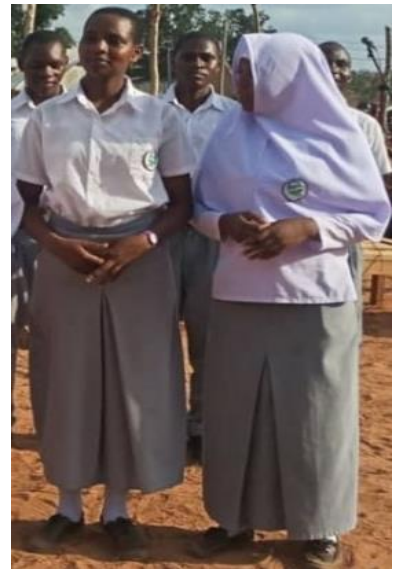
(SKETI YA DARASANI)