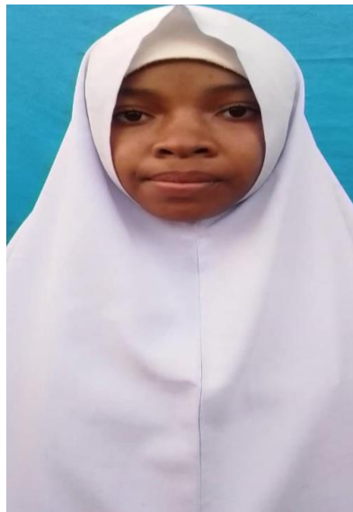
(HIJABU YA "DARASANI")