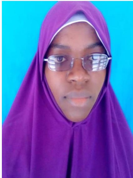
(HIJABU YA "SHAMBA DRESS")