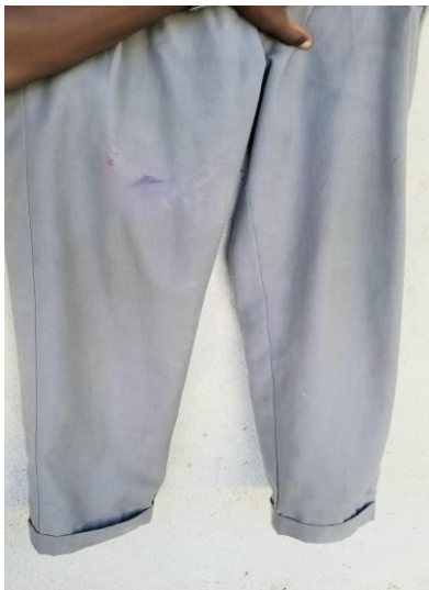
(SURUALI YA DARASANI)