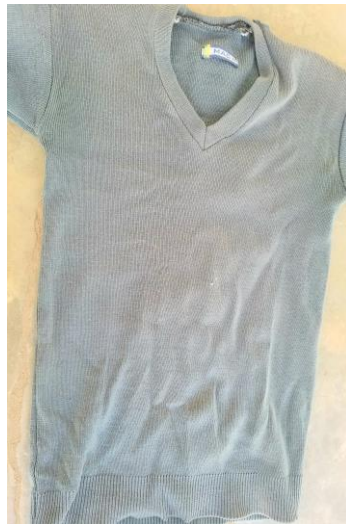
(SWETA MIKONO MIREFU)