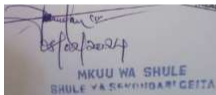
A.I. DAUDA MKUU WASHULE