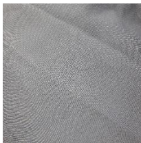
Kitambaa cha suluari