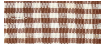
Figure 1: Shamba dress (gauni refu)