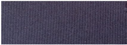
Fig 1.Sketi na Sweta (kijivu iliyokolea)