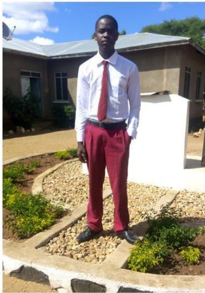
SARE ZA DARASANI