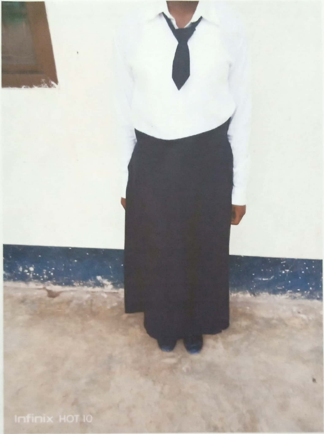
HII SKETI NYEUSI