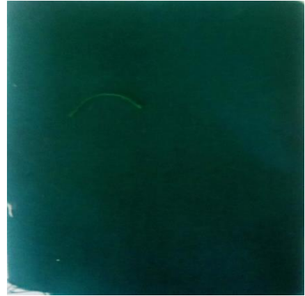
2. Kitambaa cha sketi 1