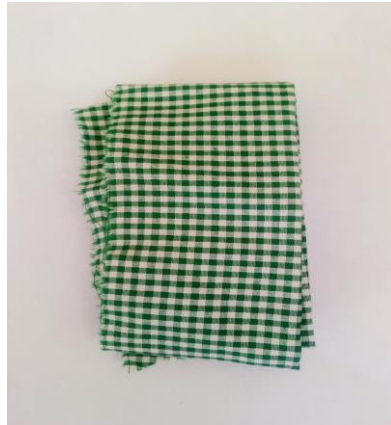
3. Shamba dress