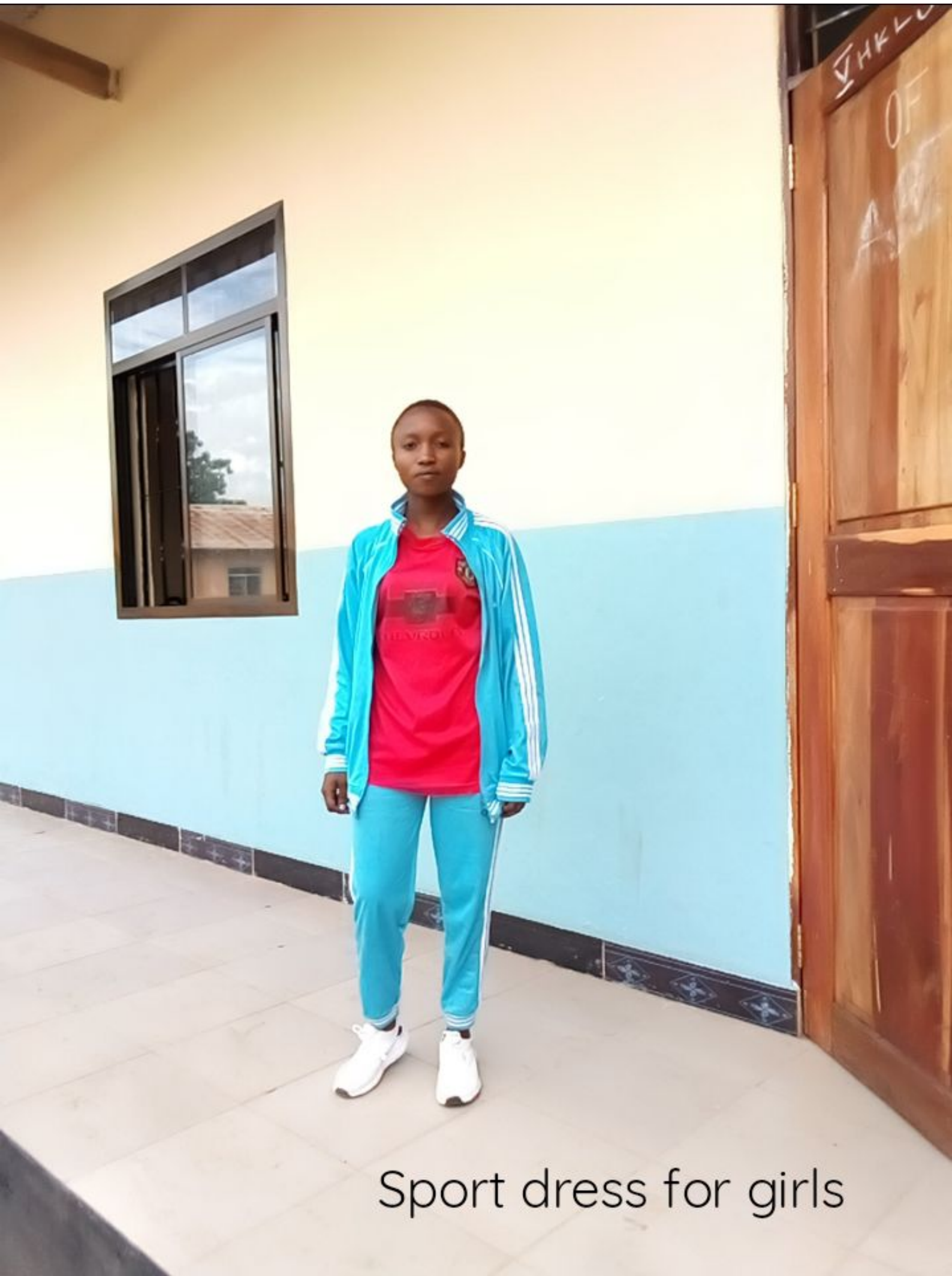
Sport dress for girls