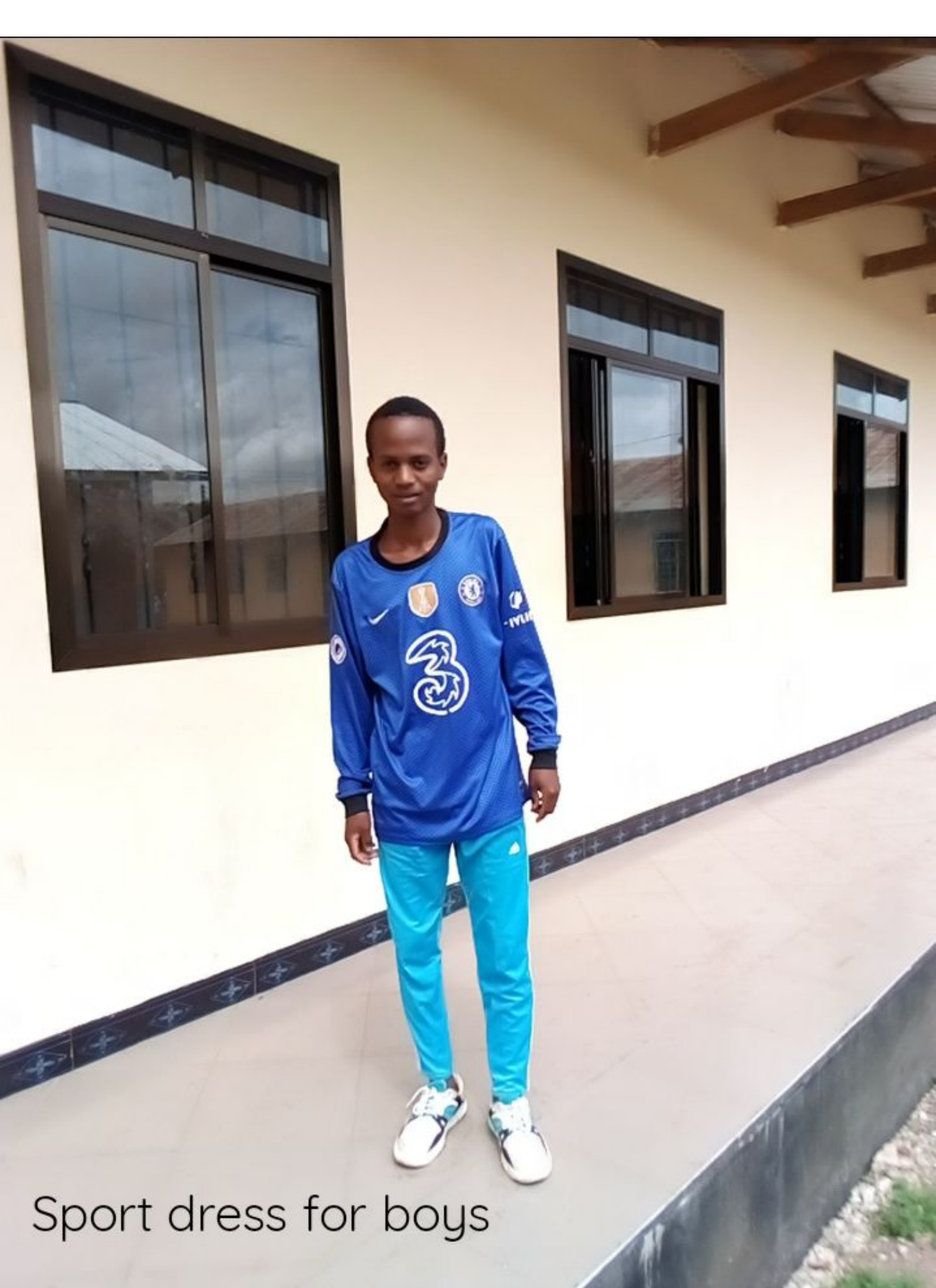
Sport dress for boys