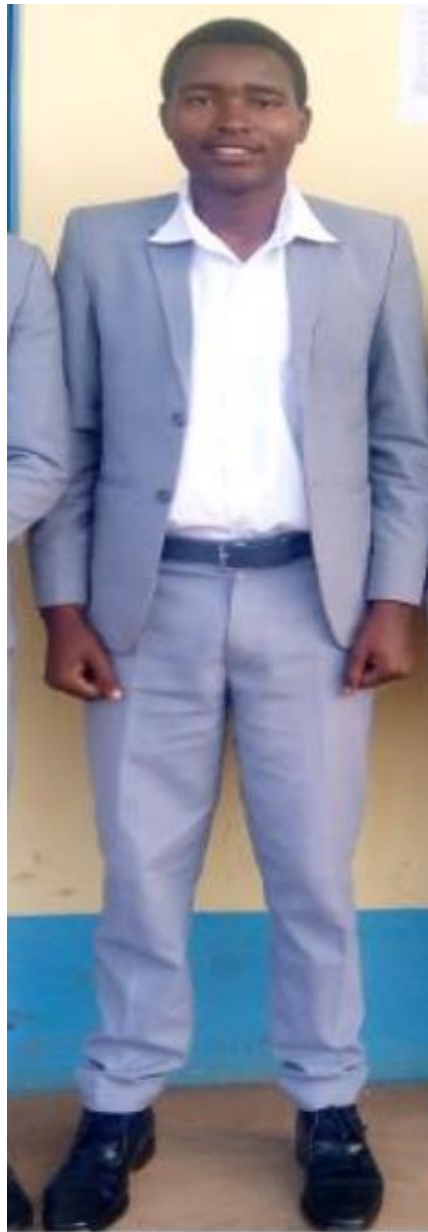
RANGI YA SUTI

Kazibwa MKUU WA SHULE LUPEMBE SEKONDARI S.L.P 114 NJOMBE