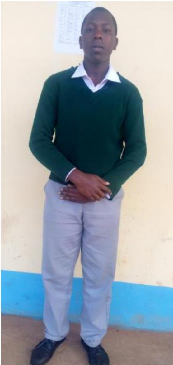
RANGI YA SWETA