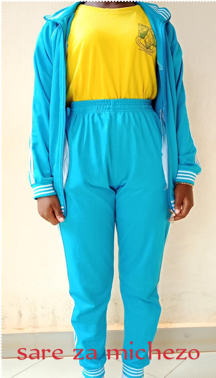
sare za michezo