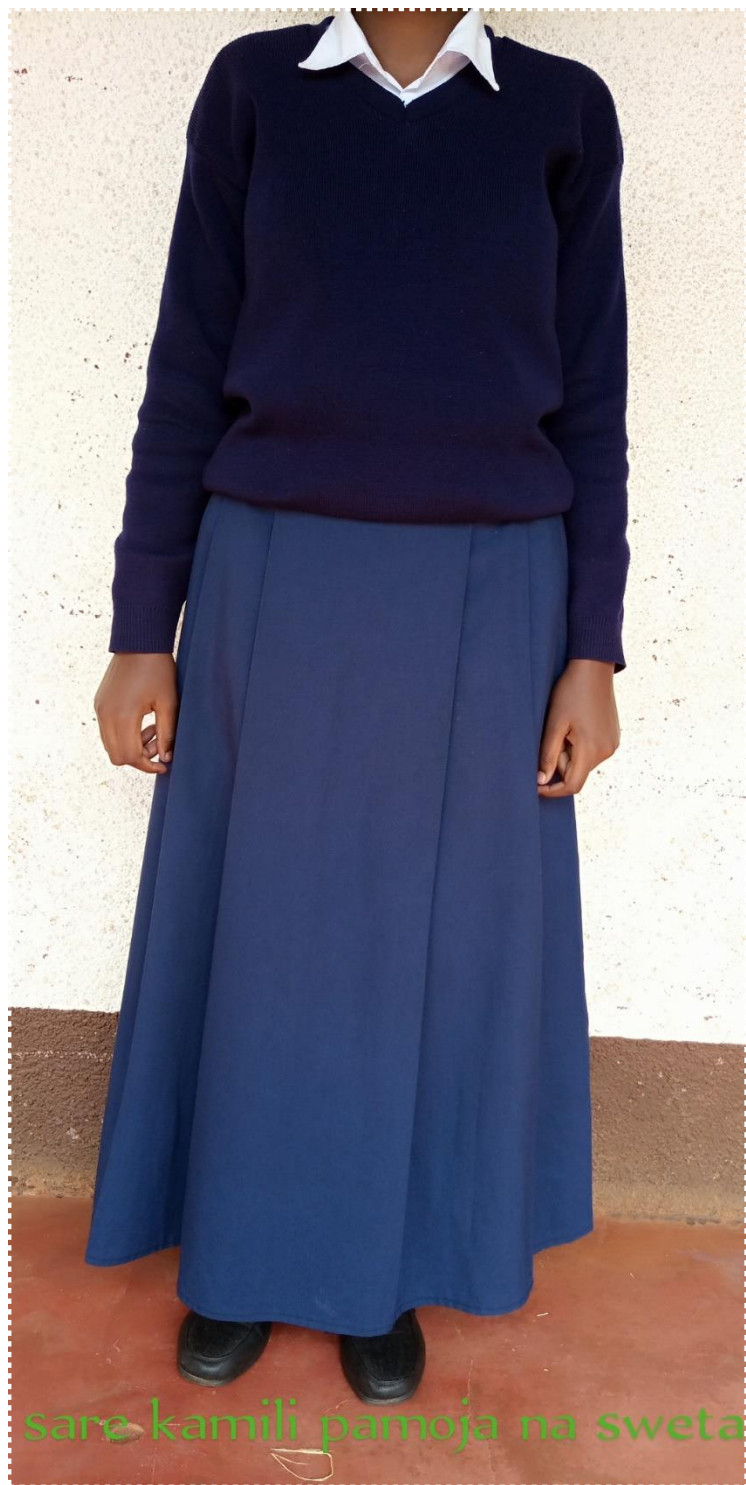
sare kamili pamoja na sweta