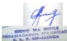
MGIMWA, D K L MKUU WA SHULE