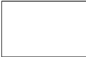
Picha ya mwanafunzi

Nakiri kwamba yaliyoandikwa hapo juu kwenye fomu zote mbili (MSS.K5. A na MSS.K5. B) ni sahihi.