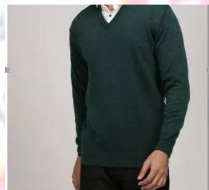
SWETA LA SHULE - (DARK GREEN)