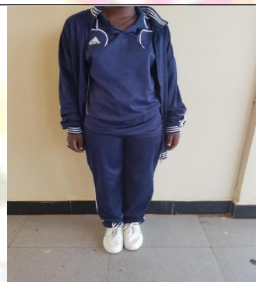
SARE YA MICHEZO