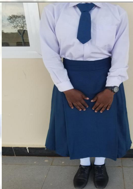
SARE YA SHULE