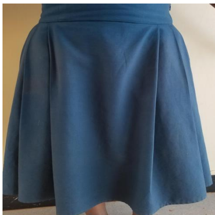
SKETI YA SHULE