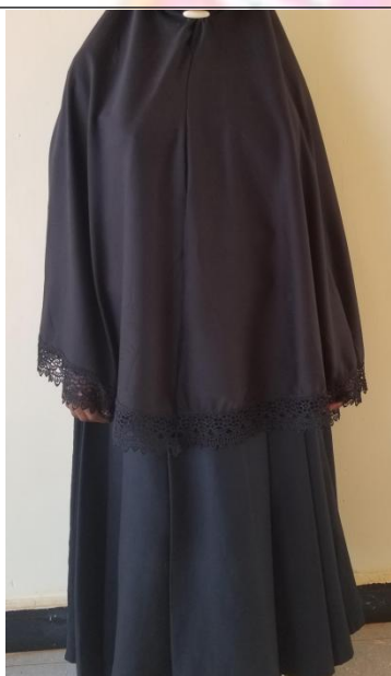
VAZI LA KIISLAMU