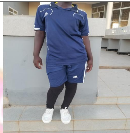
SARE YA MICHEZO