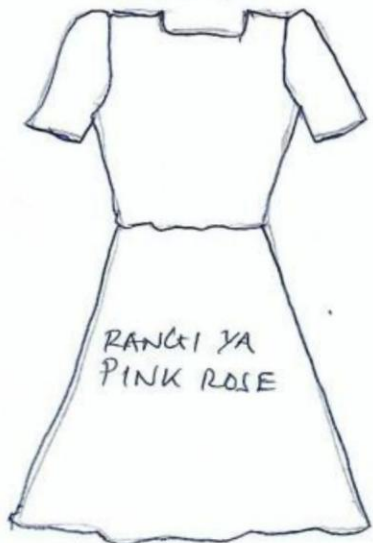
3 St(AME D&& (GA us! LA <<A) 18F LE NA)