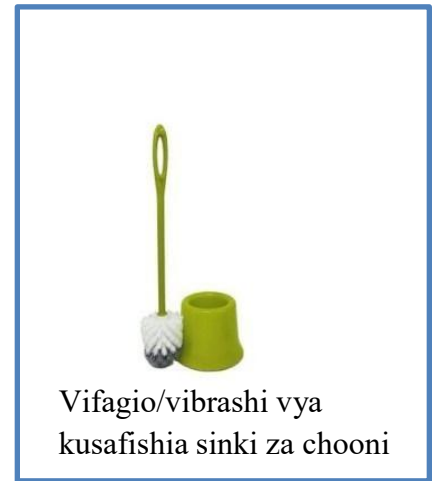
Vifagio/vibrashi vya kusafishia sinki za chooni