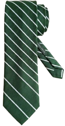
TAI YA SHULE