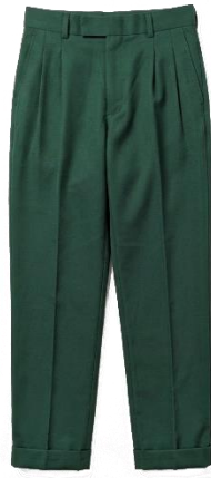
SURUALI YA SHULE