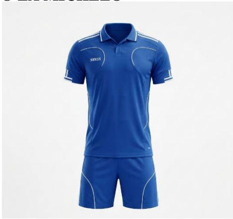
NGUO ZA MICHEZO