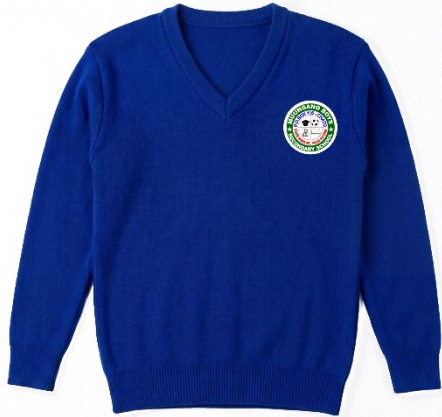
SWETA LA SHULE