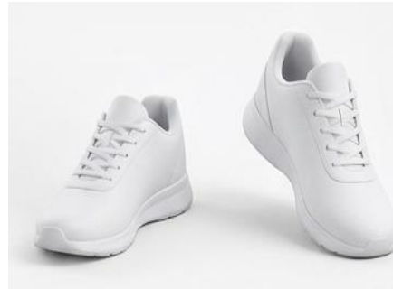
RABA ZA MICHEZO