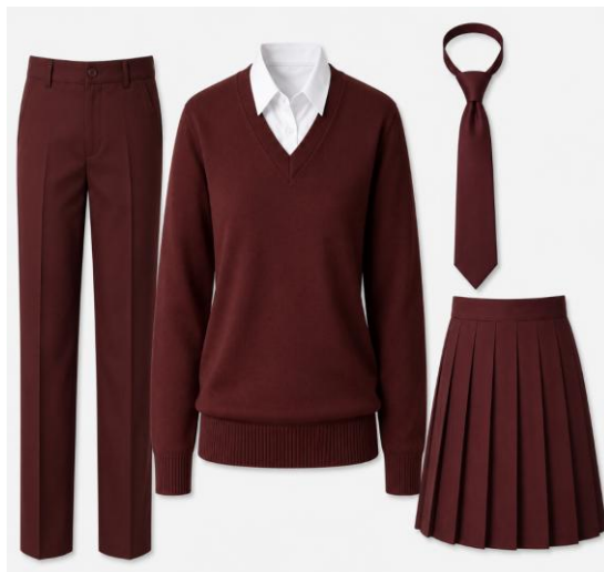
Mfano wa rangi ya kitambaa kwa sare ya shule