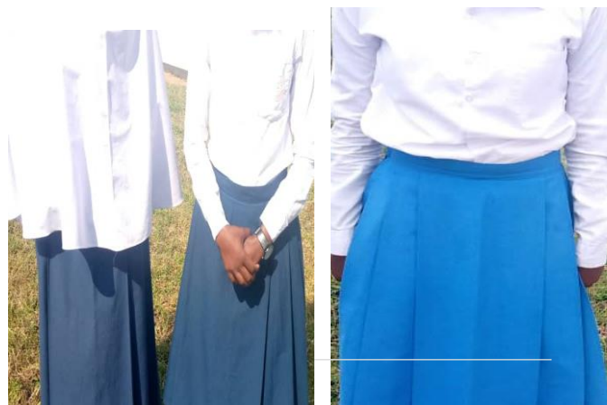
Vitambaa hivi ni vya sketi