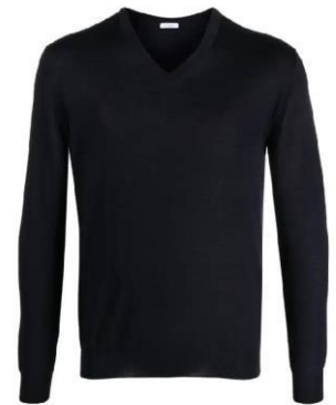
Sweta jeusi la cola ya V