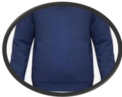
Figure 2 Sweta la shule