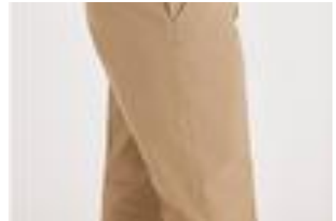
Figure 1 Suruali ya shule