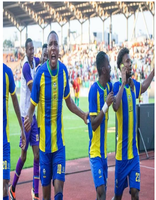
Mfano wa Jezi ya Taifa Stars inayohitajika