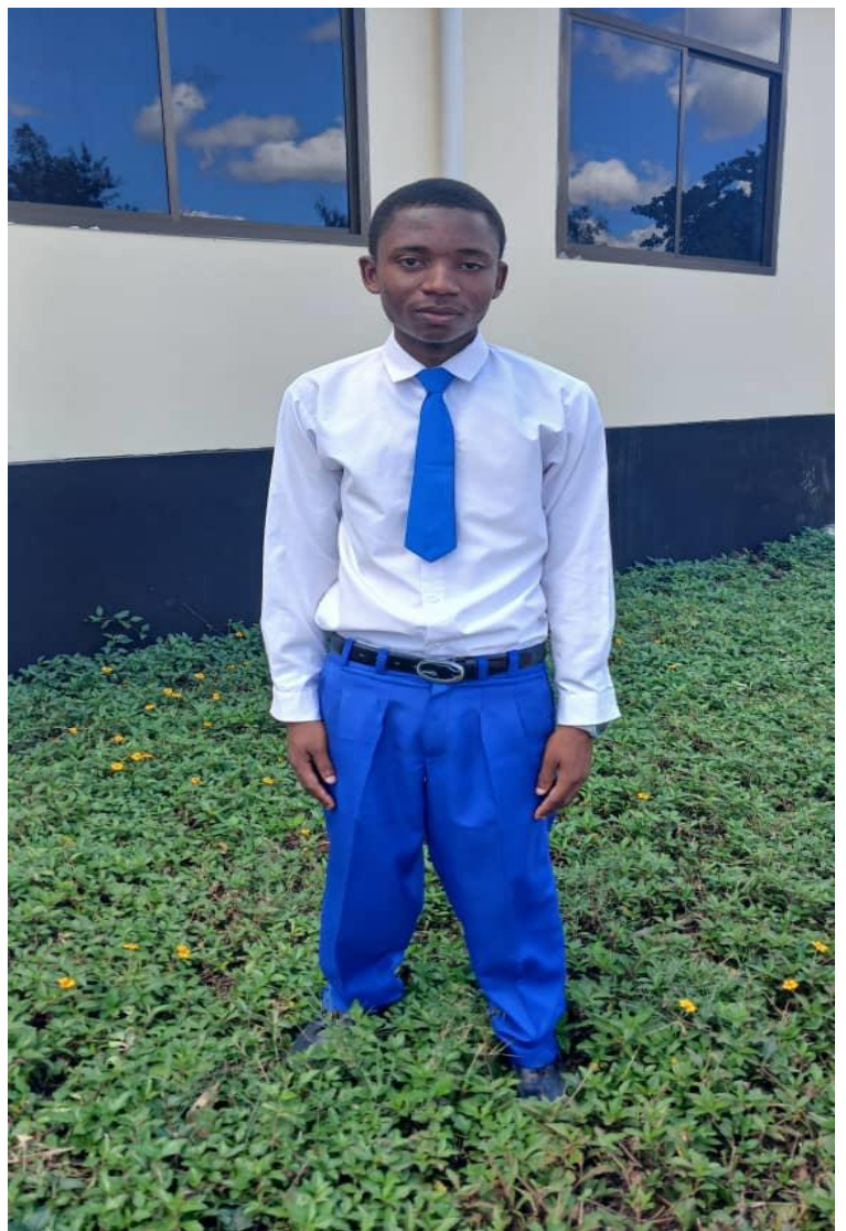
Mwanafunzi akiwa amevaa Sara ya Shule