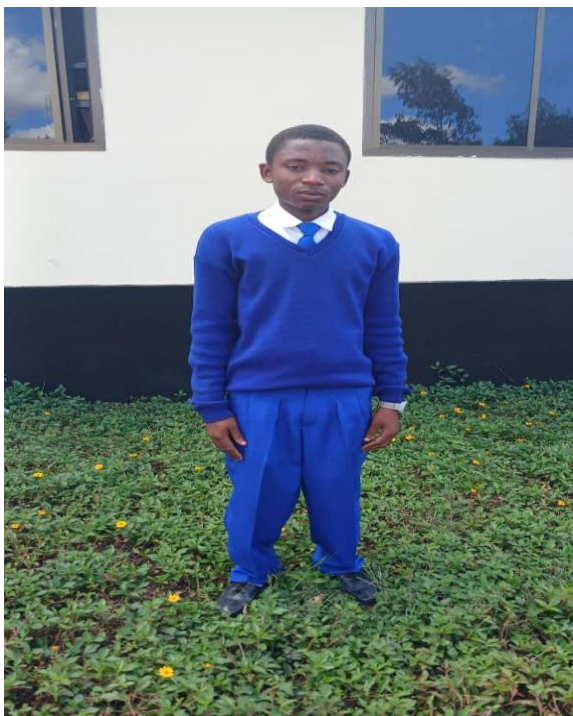
Mwanafunzi akiwa amevaa suweta la bluu