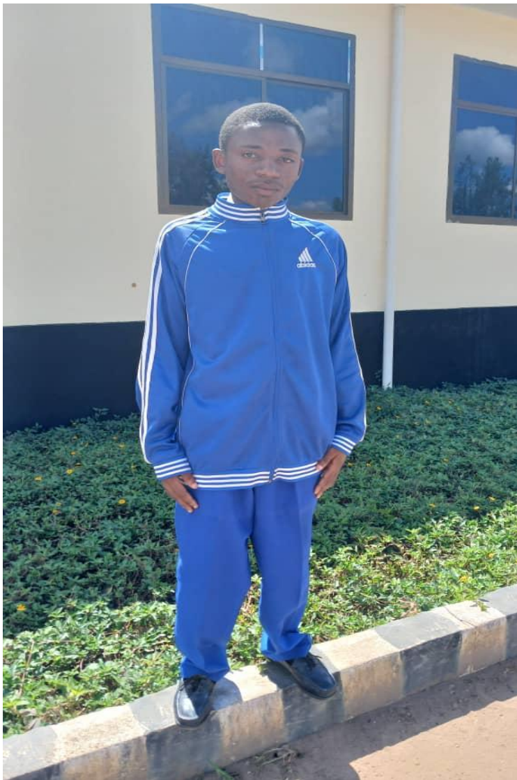
Tracksuit bluu na Suruuri Bluu bahari (Nguo za Nje)