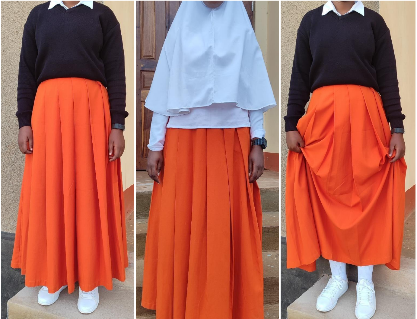
SARE RASMI ZA DARASANI ZINGATIO: SKETI IWE NDEFU HADI KWENYE KISIGINO