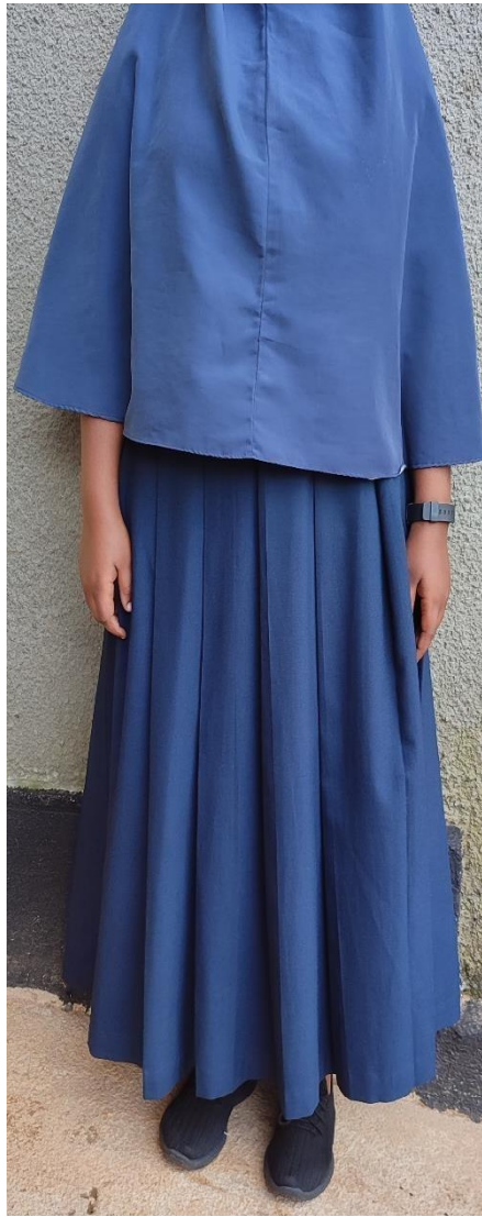
“ SHAMBA-DRESS “