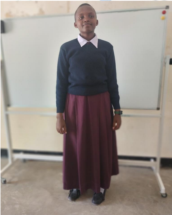
SARE YA DARASANI