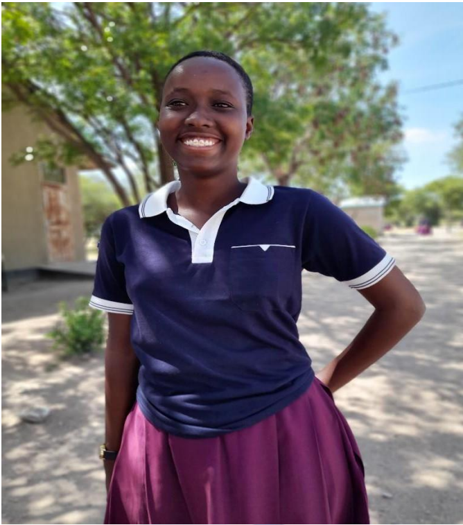
T-SHIRT YA SHULE