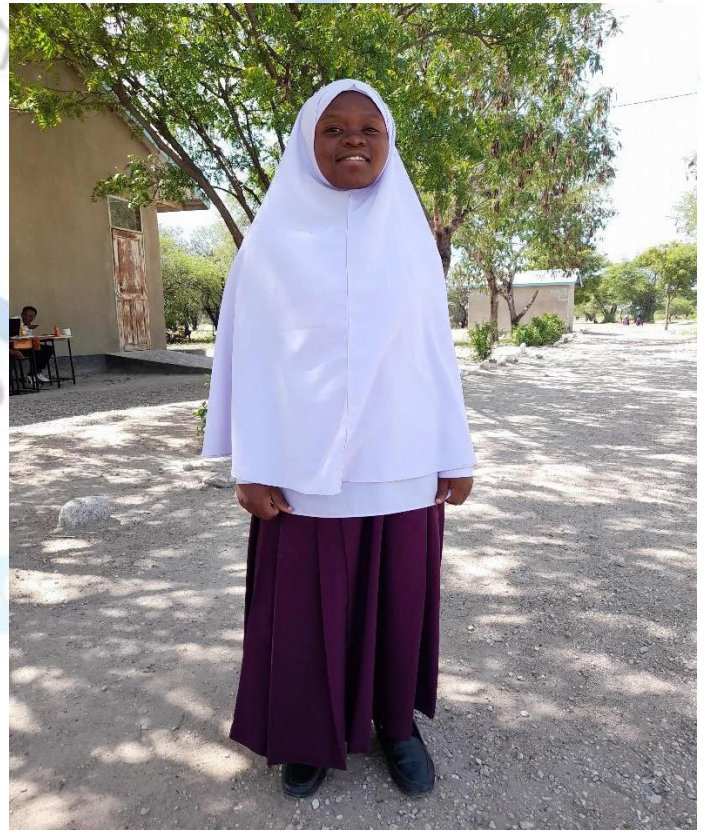
SARE YA DARASANI KWA WAISLAM