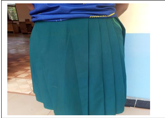
Sketi ya Shule