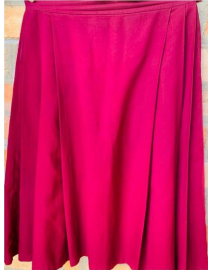
Sketi ya kushindia