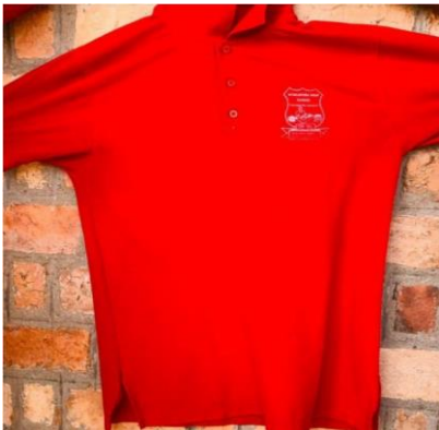
T-shirt ya darasani