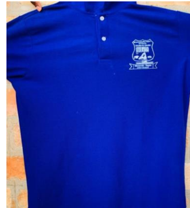
T-shirt ya kushindia