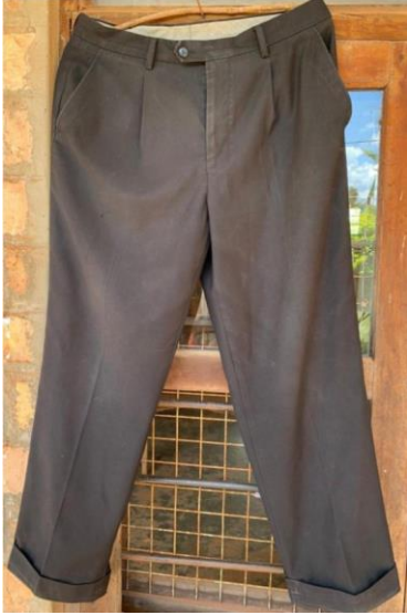
Suruali ya darasani