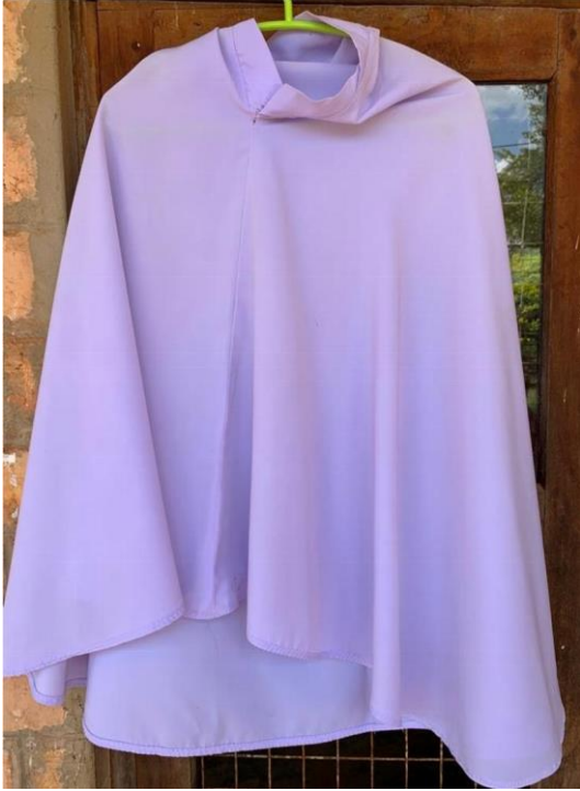
Juba la darasani