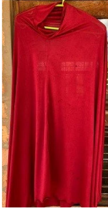
Juba la kushindia