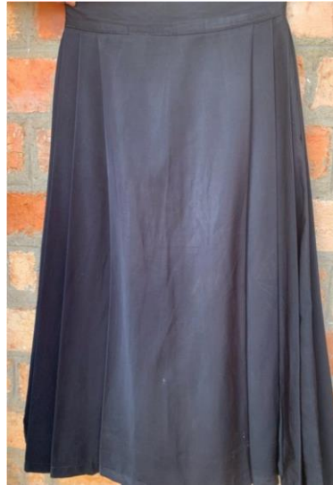
Sketi ya darasani