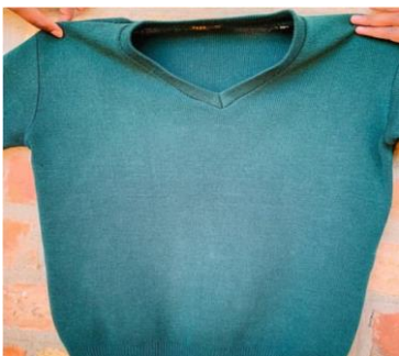
Sweta ya shule