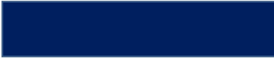
SHAMBA DRESS DARK BLUE