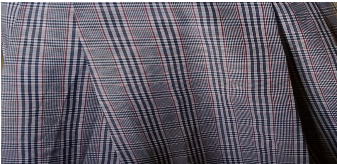
Rangi ya sketi (draft )