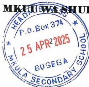
..... CHRISTER K KALEGA MKUU WA SHULE

KAGERA---MWANZA----LAMADI-----MKULA SS KIBAONI MUSOMA-- -LAMADI-----MKULA SS KIBAONI