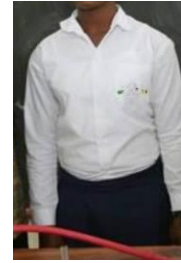
Mfano wa Tai