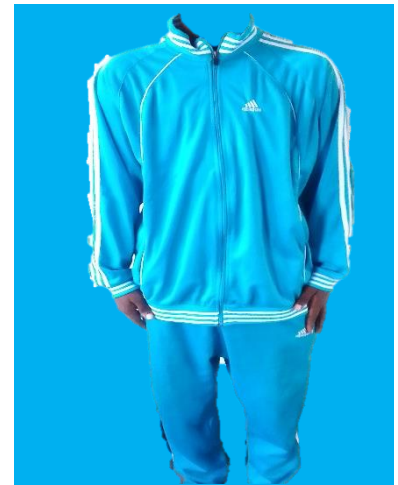
Track suit rangi ya blue bahari