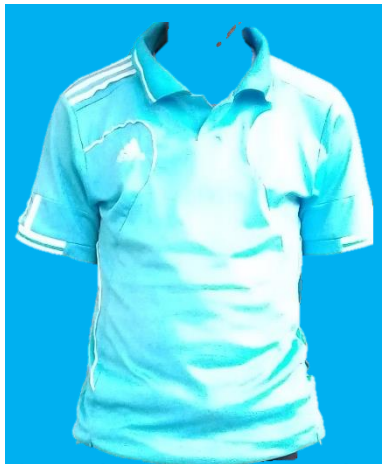
Fulana la ndani la track suit