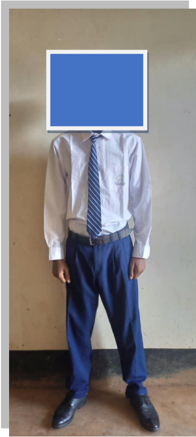
Sare ya jumla