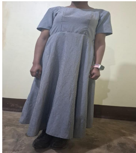
Rangi ya kitambaa cha shamba dress