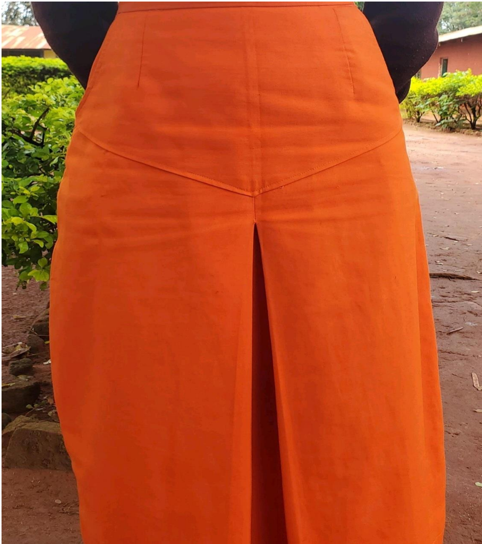
Sketi ya shule rangi ya karoti

Viambatanisho vya rangi sketi na mshono wake pamoja na sweta la shule