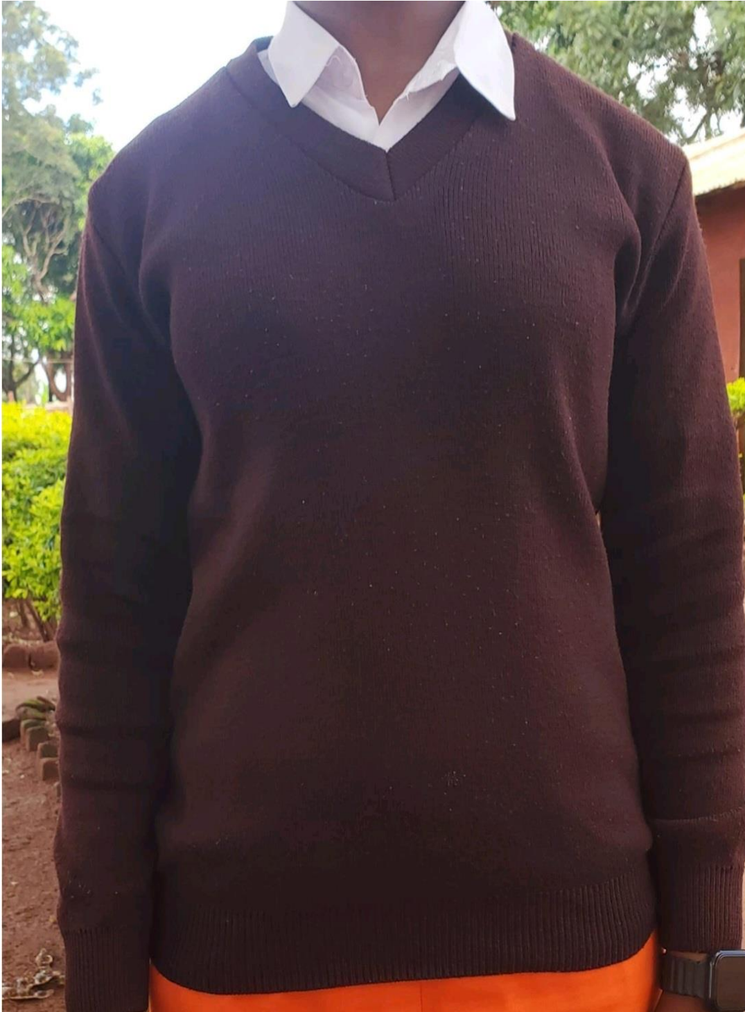
Sweta la shule rangi ya chocolate