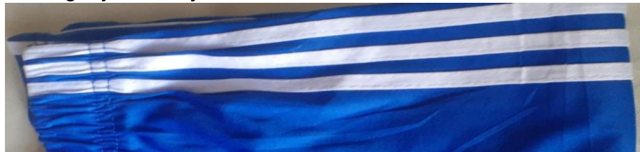
BUKTA IAMBATANE NA FULANA YA BLUU