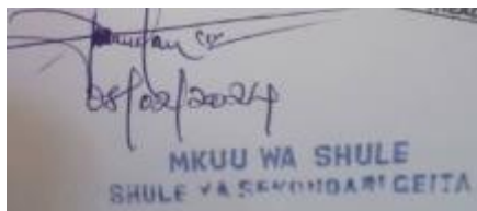
A.I. DAUDA MKUU WA SHULE