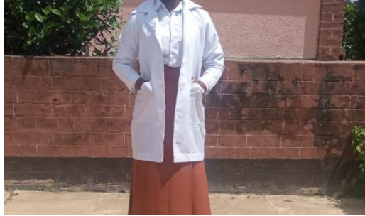
Koti jeupe (Lab coat).