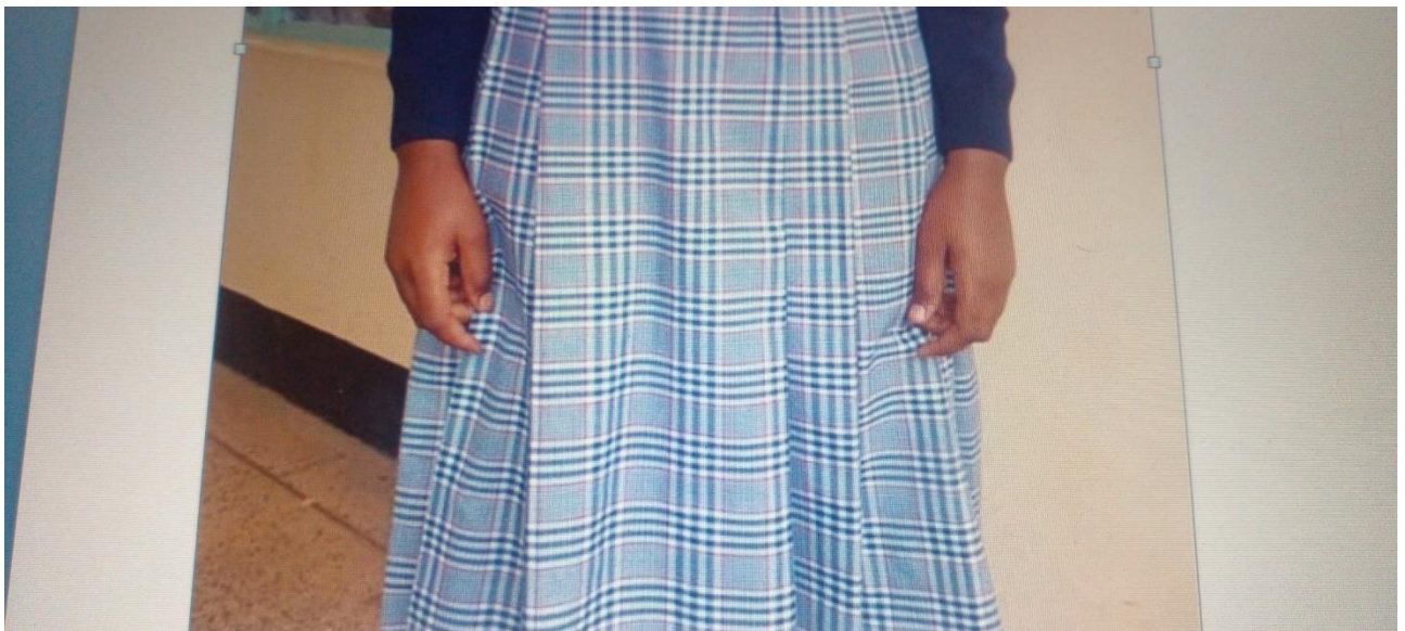
Kitambaa cha sketi