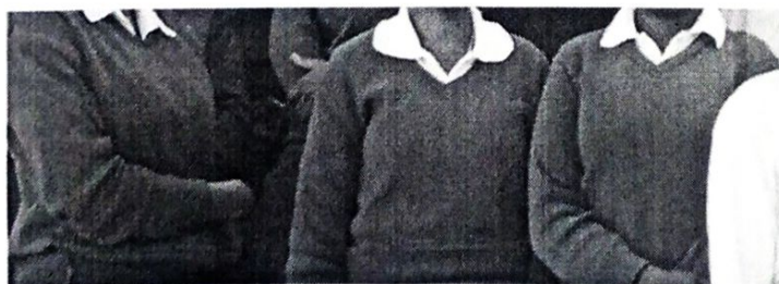
Fig. Mshono wa sweta dark Blue na Light grey