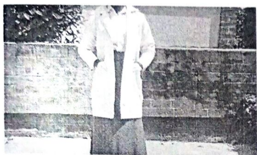
FIG. Mshono wa Lab coat