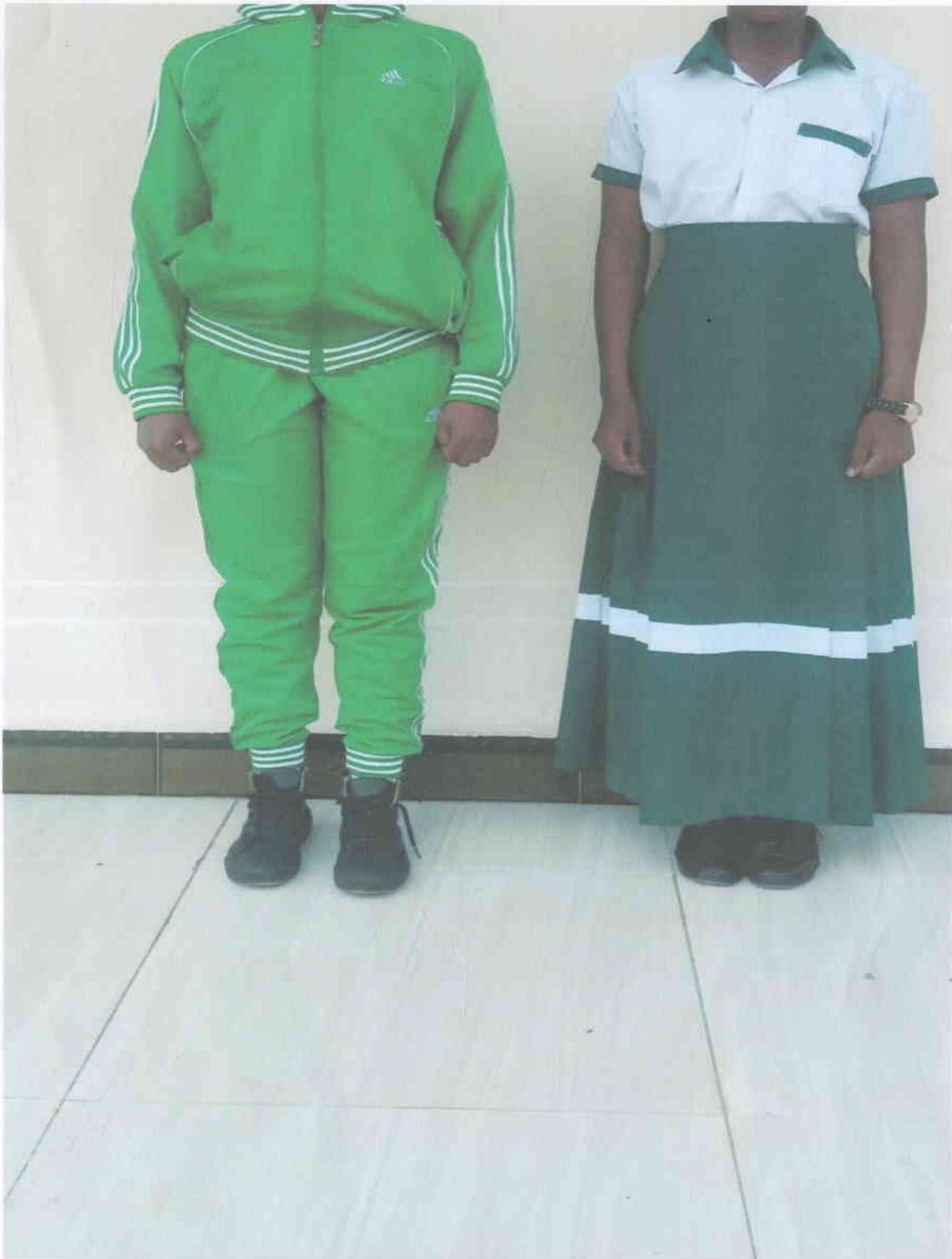
TRACK SUIT, SHATI NA SKETI