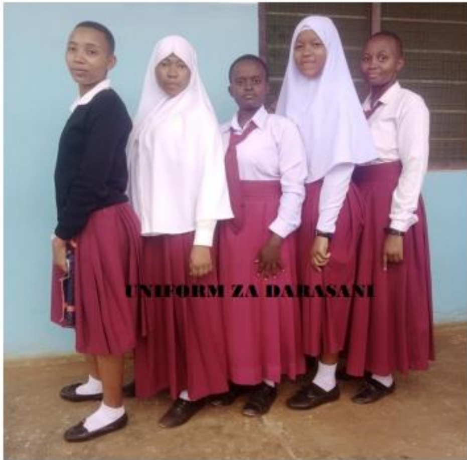
UNIFORM ZA DARASANI