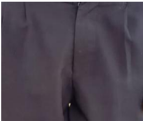
Suruali ya Nyeusi