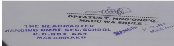
OPTATUS MNG'ONG'O MKUU WA SHULE